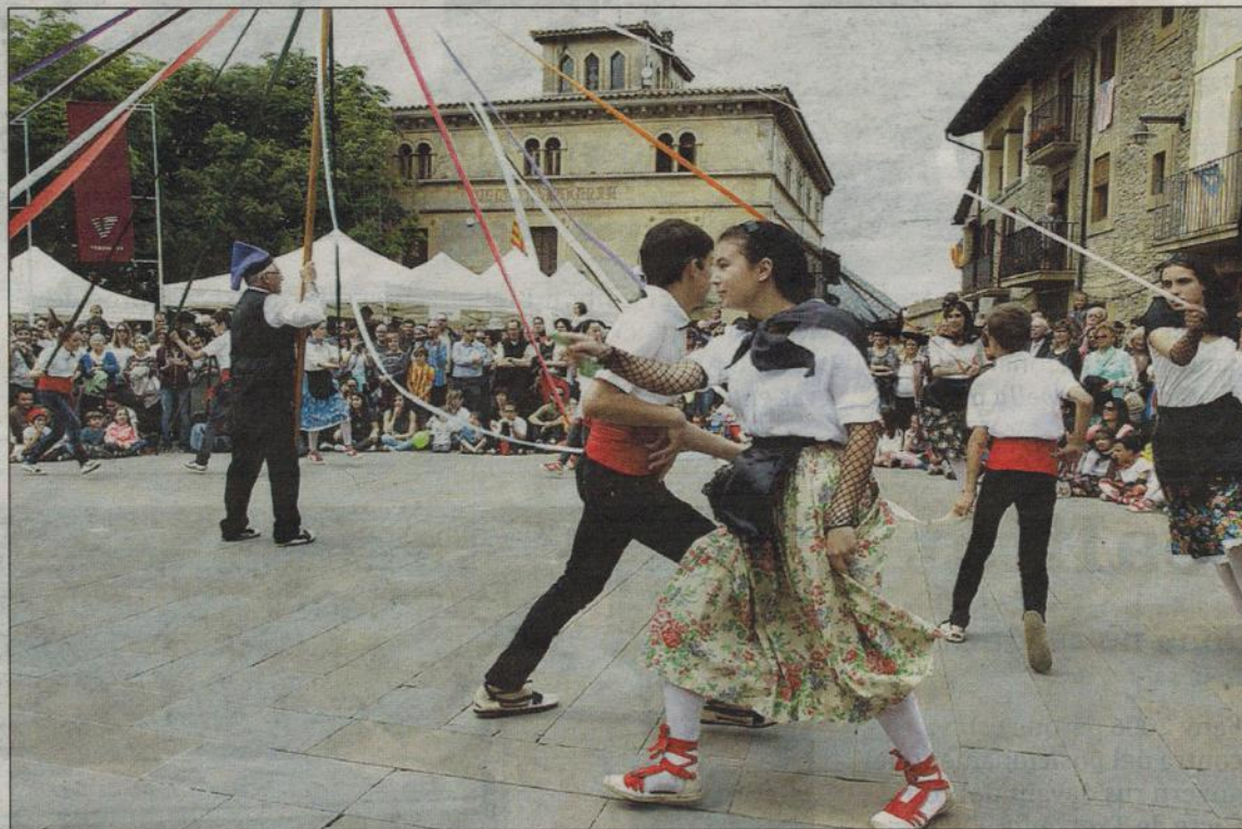
El Ball de les Cintes, un dels quatre que es ballen el diumenge a Folgueroles, interpretat per nois i noies joves

Només el darrer acte del matí de diumenge, el parlament final del convidat d'honor als jardins de Can Dachs, va caure de la programació de la Quinzena Literària Verdaguer a causa de l'absència de representació institucional del govern balear. Els folguerolencs van viure el dia central dels actes dedicats al seu poeta com és habitual, igual que si fos una segona –gairebé primera– festa major del poble. L'ofrena floral, el concurs de rams de flors i els ballets van fer homenatge a Verdaguer, que enguany ha compartit honors amb Ramon Llull: el mallorquí que al segle XIII va posar les bases del català literari i el català que al segle XIX el va fer arribar a tot el món.